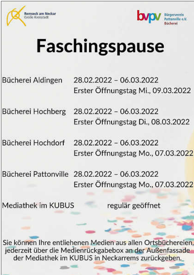
Plakat: Mediathek im KUBUS