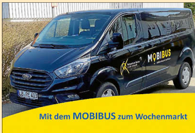
Mit dem MOBIBUS zum Wochenmarkt

Der MOBIBUS ermöglicht Remsecker Senioren, Familien und Bürgerinnen und Bürgern mit kognitiven und/oder körperlichen Einschränkungen mehr Mobilität im Stadtgebiet.