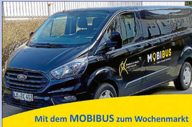
Mit dem MOBIBUS zum Wochenmarkt

Der MOBIBUS ermöglicht Remsecker Senioren, Familien und Bürgerinnen und Bürgern mit kognitiven und/oder körperlichen Einschränkungen mehr Mobilität im Stadtgebiet.