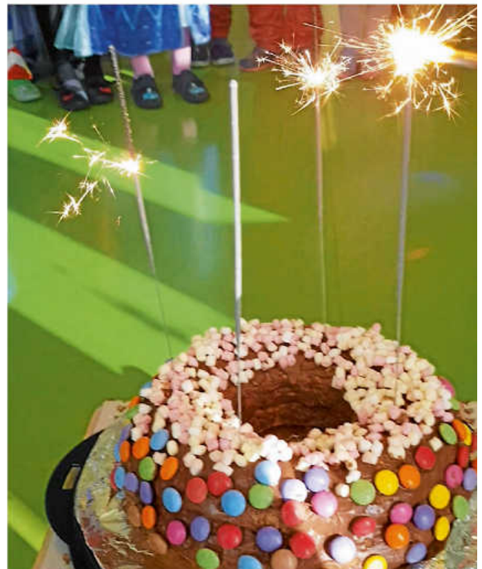
Waffelstand und Kuchen-UFO