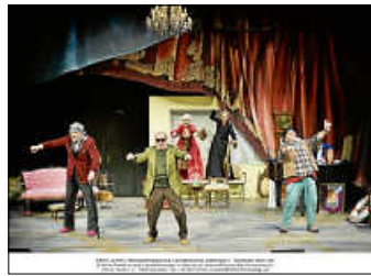
Musiktheater „Ewig Jung“

Wir schreiben das Jahr 2070, die Württembergische Landesbühne Esslingen hat bereits vor Jahren den Theaterbetrieb eingestellt und dient nun als Altersheim für das mittlerweile recht hochbetagte ehemalige Schauspielensemble. Allabendlich treffen sie sich nun auf der Bühne und legen Zeugnis einer längst vergangenen, glorreichen Epoche ab. In einer kollektiven Retrospektive blicken sie auf ihre vergangenen Bühnenerfolge zurück, erleben noch einmal ihre großen Rollen, verstricken sich in alte Zankereien und widmen sich dabei auch den musikalischen Meisterwerken ihrer Jugend – mit „Forever Young“ und „I will survive“ lassen sie selbst im Ruhestand die Bretter erzittern, die die Welt bedeuten.