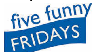
Five Funny Fridays 2022

Einzeltickets im Vorverkauf: 17 Euro / erm. 15 Euro; Abendkasse: 19 Euro / erm. 17 Euro