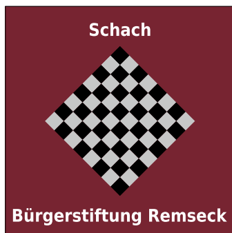
Logo: Gerald Winkler

Übrigens: Nächster Schachtreff ist am Donnerstag, 17. März, um 19 Uhr im Haus der Bürger in Aldingen. Gäste sind stets willkommen.