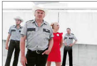
Los Santos

Mit dem Programm "Cowboys & Cosmonauts" huldigen Los Santos den Weltraumphantasiën und dem Sound der 1960er Jahre. Sie verbinden flirrende Orgeln, analoge Effekte, Gitarren mit viel Twang, exotische Rhythmen und betörenden Duettgesang mit Geschichten von Raumschiffen, der Suche nach dem Glück in den Tiefen des Weltraums und von der großen Liebe, deren Glut leider eine atomare Kettenreaktion auslöst. Dazwischen zeigen Los Santos mit einem ganz irdischen Liebeslied oder einer schmutzigen Tanznummer immer wieder, dass sie ihre Bodenhaftung nicht verloren haben.