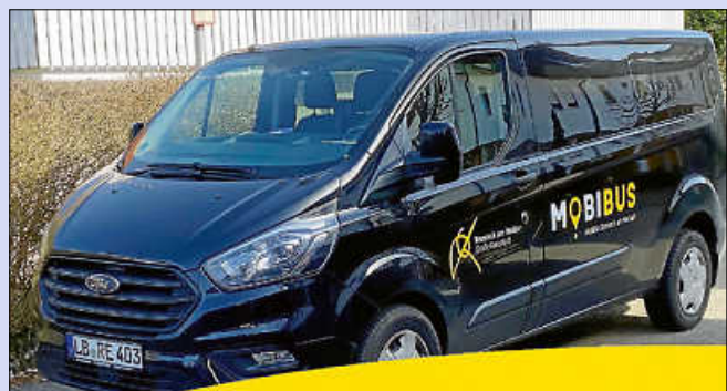
Mit dem MOBIBUS zum Wochenmarkt

Der MOBIBUS ermöglicht Remsecker Senioren, Familien und Bürgerinnen und Bürgern mit kognitiven und/oder körperlichen Einschränkungen mehr Mobilität im Stadtgebiet.