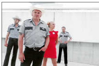
Los Santos

Mit dem Programm „Cowboys & Cosmonauts“ huldigen Los Santos den Weltraumphantasien und dem Sound der 1960er Jahre. Sie verbinden flirrende Orgeln, analoge Effekte, Gitarren mit viel Twang, exotische Rhythmen und betörenden Duettgesang mit Geschichten von Raumschiffen, der Suche