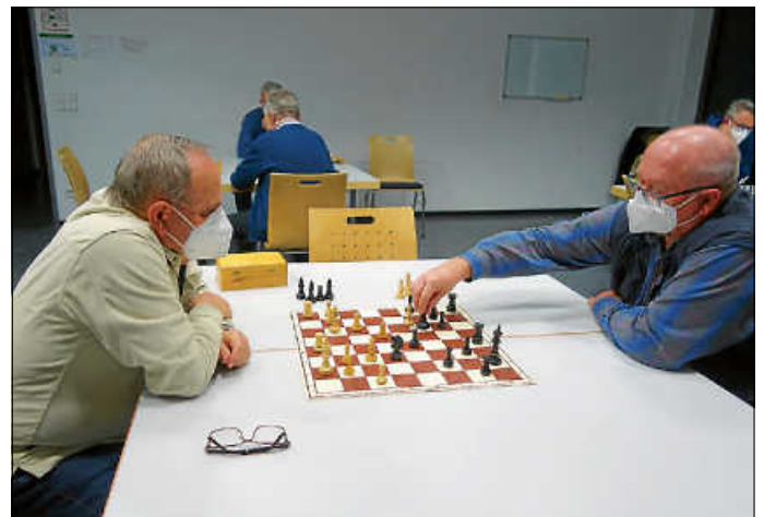
Schach wird mit Abstand und Maske gespielt