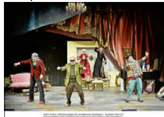
Musiktheater „Ewig Jung“

Wir schreiben das Jahr 2070, die Württembergische Landesbühne Esslingen hat bereits vor Jahren den Theaterbetrieb eingestellt und dient nun als Altersheim für das mittlerweile recht hochbetagte ehemalige Schauspielensemble. Allabendlich treffen sie sich nun auf der Bühne und legen Zeugnis einer längst vergangenen, glorrei-