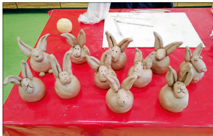
Osterhasen in der Hobbybude