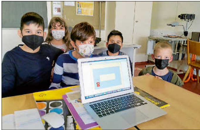
Die Teilnehmer am Workshop

eigene Rennstrecke entworfen, die dann mit dem virtuellen Auto befahren wurde. Wir freuen uns, dass der Workshop so toll angekommen ist bei allen Teilnehmern.