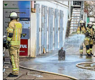
Eine mit Wärme beaufschlagte Gasflasche wird gekühlt

Zu einem Brand in einer Gewerbeimmobilie im Gewerbegebiet Aldingen wurde die Feuerwehr Remseck am Sonntagabend alarmiert. Beim Eintreffen der Feuerwehr brannte es in einem Raum im zweiten Obergeschoss. In diesem Raum befanden sich auch mehrere Gasflaschen. Die Feuerwehr löschte das Feuer, verbrachte die mit Flammen beaufschlagten Gasflaschen ins Freie und kühlte diese ab. Im Anschluss mussten Teile des Gebäude belüftet werden. Verletzt wurde niemand.(tl)