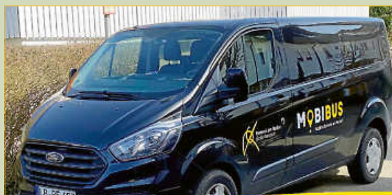
Mit dem MOBIBUS zum Wochenmarkt

Der MOBIBUS ermöglicht Remsecker Senioren, Familien und Bürgerinnen und Bürgern mit kognitiven und/oder körperlichen Einschränkungen mehr Mobilität im Stadtgebiet.