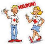
Grafik: JRK Remseck