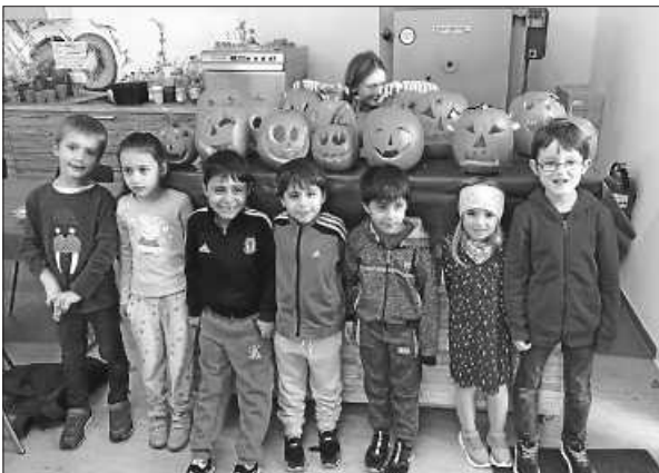
Kürbisschnitzen in der Hobbybude Teil 1