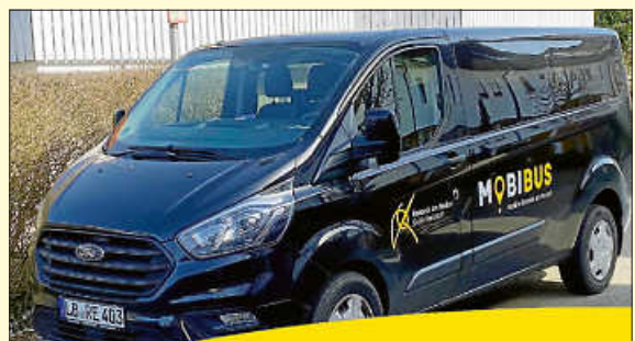
Mit dem MOBIBUS zum Wochenmarkt

Der MOBIBUS ermöglicht Remsecker Senioren, Familien und Bürgerinnen und Bürgern mit kognitiven und/oder körperlichen Einschränkungen mehr Mobilität im Stadtgebiet.