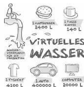
Grafik: Realschule Remseck

Und wir als Schule haben uns beteiligt und am 26. September