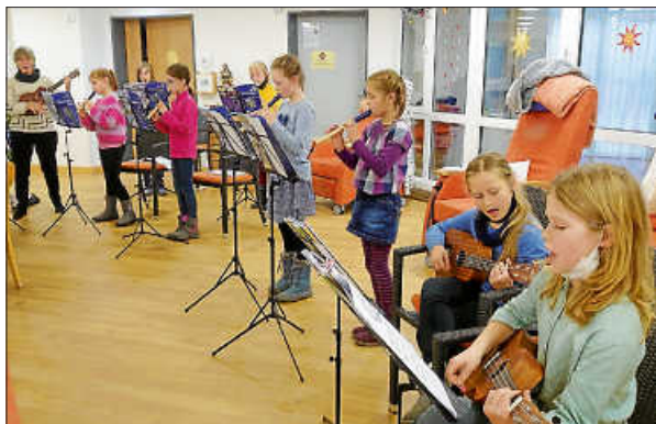
Flötengruppe der Jugendmusikschule

„Bald nun ist Weihnachtszeit, fröhliche Zeit ...“