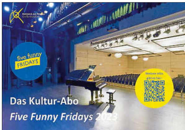
Plakat: Stadt Remseck am Neckar

Wir freuen uns darauf, viele altbekannte und neue Abonnentinnen und Abonnenten in der Stadthalle begrüßen zu dürfen!