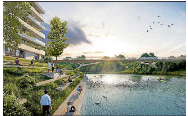
Neue Mitte Remseck