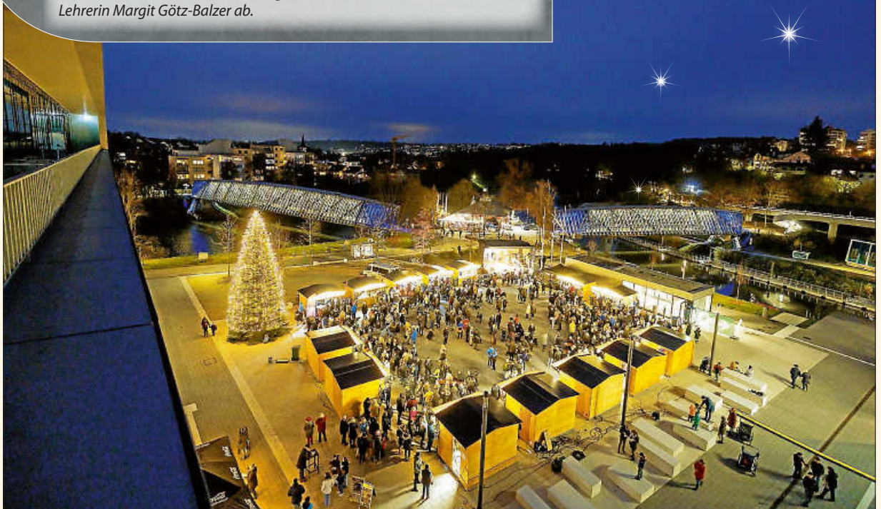
Der Remsecker Weihnachtsmarkt bei Dunkelheit ...