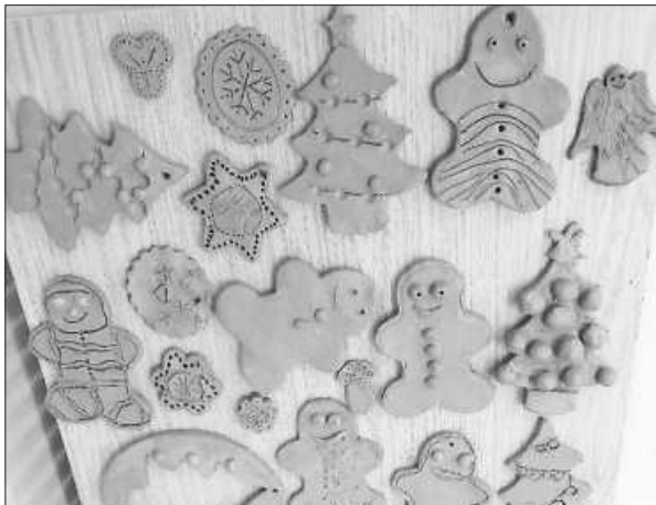
Tonkurs Nov/Dez 2022

Auch in diesem Jahr sind die Weihnachtsvorbereitungen in der Hobbybude in vollem Gange. Die Kinder des Tonkurses haben mit Silke und Petra fleißig getont und schöne Kunstwerke geschaffen. Diese müssen noch glasiert werden und können dann am 16. Dezember in der Bude abgeholt werden. Am Dienstag hat der Kinderfilzkurs stattgefunden ... (Bericht folgt). Wir wünschen allen eine wundervolle Adventszeit! Euer Team der Hobbybude