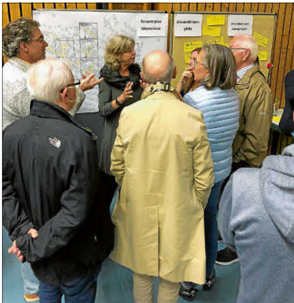
Bürgerbeteiligung zur Ortsdurchfahrt Hochberg

Bei allen Beteiligungen traf die Stadtverwaltung stets auf eine positiv gestimmte Bevölkerung, der das Leben und Wohlfühlen in ihrer Stadt oder ihrem Stadtteil wichtig war. Alle Meinungen und Rückmeldungen, die wir erhalten haben, waren vielseitig und beleuchteten die Projekte aus unterschiedlichen Richtungen. Die Stadtverwaltung möchte sich daher ganz herzlich bei allen Einwohnerinnen und Einwohnern bedanken, die sich 2022 beteiligt haben und hofft auf eine rege Beteiligung in 2023. Bleiben Sie neugierig!