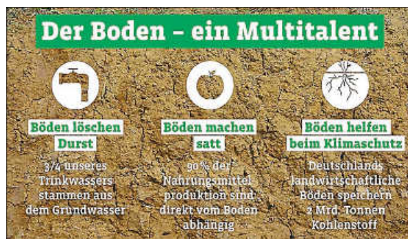
Plakat: Bundesregierung

Noch bis 09.12.2022 widmen wir uns daher ganz dem Thema „Böden“. Sie haben die Möglichkeit, sich in den Remsecker Büchereien und in der Mediathek zu informieren, darüber zu lesen oder sich (in der Mediathek über ein Tablet) in unserem Online-Brockhaus Wissenswertes darstellen zu lassen. Hier ist für Klein bis Groß etwas dabei, kommen Sie gerne zu den üblichen Öffnungszeiten vorbei!