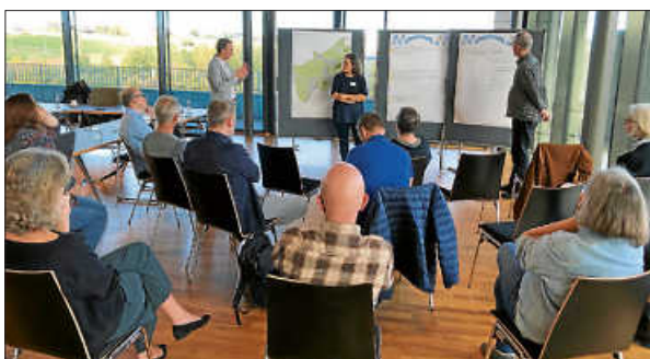
Bürgerbeteiligung zu Remseck 2035