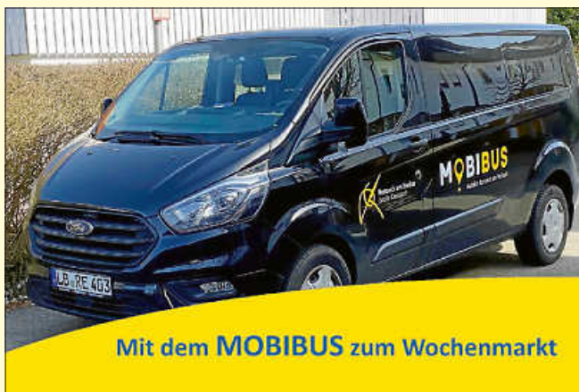
Mit dem MOBIBUS zum Wochenmarkt

Der MOBIBUS ermöglicht Remsecker Senioren, Familien und Bürgerinnen und Bürgern mit kognitiven und/oder körperlichen Einschränkungen mehr Mobilität im Stadtgebiet.