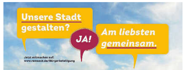
Plakat: Stadt Remseck am Neckar

Der Nutzungsdruck im Bereich Wohnen hat in den letzten Jahren erheblich zugenommen. Die hohe Standortgunst und die attraktive Wohnlage begründen daher eine Erweiterung der Ortslage des Stadtteils Neckarrems in nord-östliche Richtung, die gleichzeitig die Möglichkeit für eine harmonische Abrundung des Stadtteils schafft: Das Neubaugebiet Östlich Marbacher Straße.