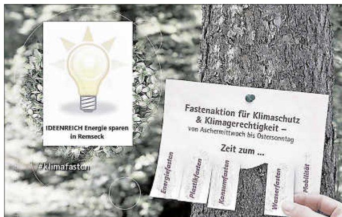
Grafik: Stadt Remseck

Energie ist wertvoll und wir sollten damit sparsam und bewusst umgehen. Je effizienter wir heizen, Licht nutzen oder kochen und je mehr wir dazu Sonne, Erdwärme und Wind nutzen, desto besser für uns alle. Zunächst geht es darum, mal bewusst wahrzunehmen: Welche energie-intensiven Gewohnheiten habe ich, wie nutze ich Energie im Alltag? An welchen Stellen kann ich ansetzen, um etwas zu verändern?