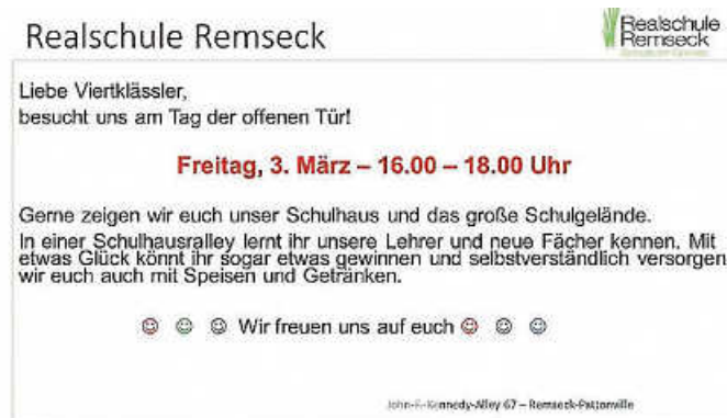
Grafik: Realschule Remseck

Wir laden alle recht herzlich ein. Merken Sie sich den Termin bereits vor: