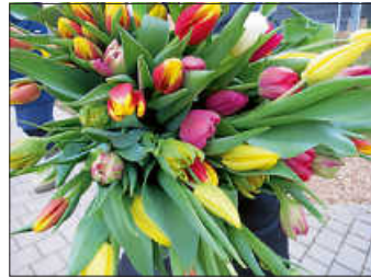
Aus dem Spalier wurde ein bunter Strauß

Anschließend hatten die Kinder auch noch ein eigenes Abschiedslied einstudiert, wobei die Erwachsenen sie unterstützten. Die Kinder wurden für ihren Einsatz gelobt und dann wurde an den Elternbeirat übergeben, der vertretungsweise für die Eltern an der Feier teilnahm. Die Elternbeiratsvorsitzende Frau Wiese richtete sich mit ein paar Worten zum Abschied an Frau