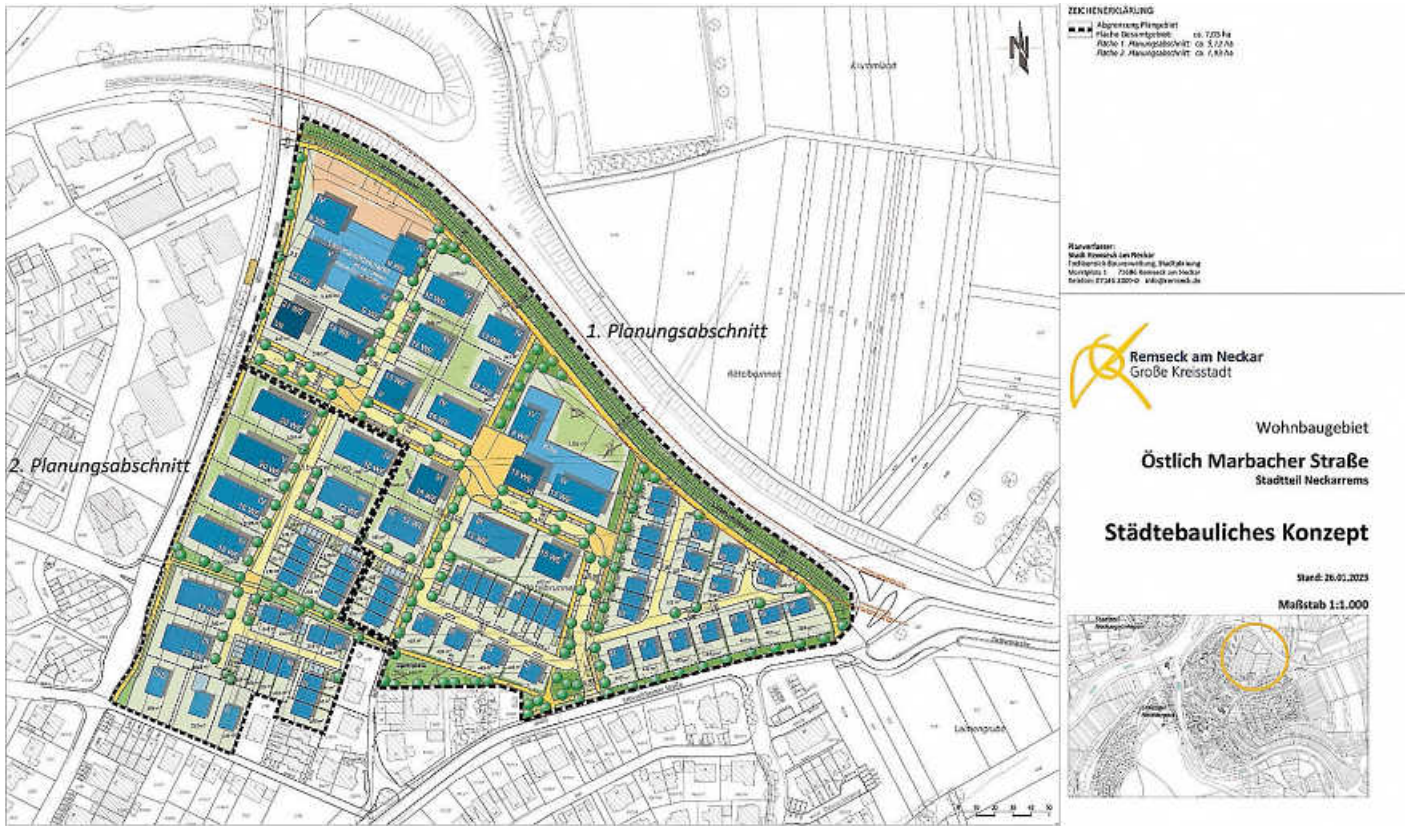
Plan: Stadt Remseck am Neckar

Alle weiteren Informationen finden Sie unter www.remseck.de/Bürgerbeteiligung/Bebauungspläne .