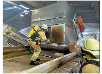
Brandmeldealarm am 22.02.2023 - 10:40 Uhr

Am 22.02.2023 um 10:40 Uhr wurde die Feuerwehr durch eine Brandmeldeanlage in das Gewerbegebiet nach Neckargröningen gerufen. Ein nicht ordnungsgemäß entsorgter Akku wurde von einer Maschine mechanisch bearbeitet, so dass dieser sich entzündete. Das Betriebspersonal reagierte sofort und löschte mit dem eigens dafür vorgehaltenen Brandbekämpfungsmaterial den brennenden Akku ab. Von der Feuerwehr wurde die Maschine und der betroffene Bereich mit der Wärmebildkamera kontrolliert, es konnte keine erhöhte Temperatur festgestellt werden. Der Einsatz konnte somit nach kurzer Beendigung. (is)