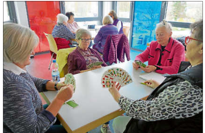
Hier wird Binokel gespielt

Es ist der Bürgerstiftung stets ein Anliegen, die Menschen in Remseck zusammen zu bringen. In ihrer Satzung ist dies so umschrieben: Als Gemeinschaftseinrichtung will sie nach dem Grundsatz „von Bürger für Bürger“ dem Gemeinwohl dienen, das Gemeinwesen nachhaltig stärken und das ehrenamtliche Engagement in Remseck am Neckar mobilisieren und unterstützen. Die Initiative zur Gründung der Skat- und Binokelgruppe liegt schon etliche Jahre zurück, dieser Treffpunkt im Haus der Bürger wird aber nach wie vor rege nachgefragt. Aus Sicht der Bürgerstiftung ist dies optimal. Den Anstoß geben, Initiativen fördern und gute Rahmenbedingungen schaffen, damit daraus ein „Selbstläufer“ wird. Das Skatspielen ist übrigens als immaterielles Kulturgut in Deutschland anerkannt. Um 1820 hat sich das Spiel in Altenburg (Thüringen) entwickelt. Die Skat- und Binokelgruppe trifft sich jeden Donnerstag von 14.30 Uhr bis ca. 17 Uhr im Haus der Bürger in Aldingen. Interessant ist, dass die Frauen in der Gruppe lieber Binokel spielen. Das Kartenspiel ist vorwiegend im württembergischen Raum beliebt und kann zu dritt oder viert gespielt werden. Es ist wohl aus französischen Kartenspielen entstanden. Die Männer in der Gruppe zieht es eher zum Skat hin. Neue Mitspieler/-innen sind gerne gesehen.