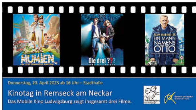
Plakat: Stadt Remseck am Neckar; MoKi Ludwigsburg

Das Kino wird durchgeführt vom MoKi Ludwigsburg.