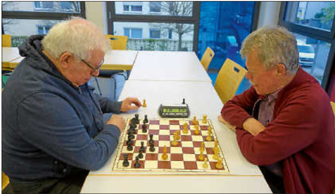
Es wird Blitzschach gespielt

Wer gerne eine Schachpartie ohne Wettkampfcharakter spielen möchte, ist beim Schachabend der Bürgerstiftung gut aufgehoben. Wir treffen uns jeden ersten und dritten Montag im Monat. Der nächste Schachtreff ist also am Montag, 19. Juni um 19 Uhr im Haus der Bürger in Aldingen.