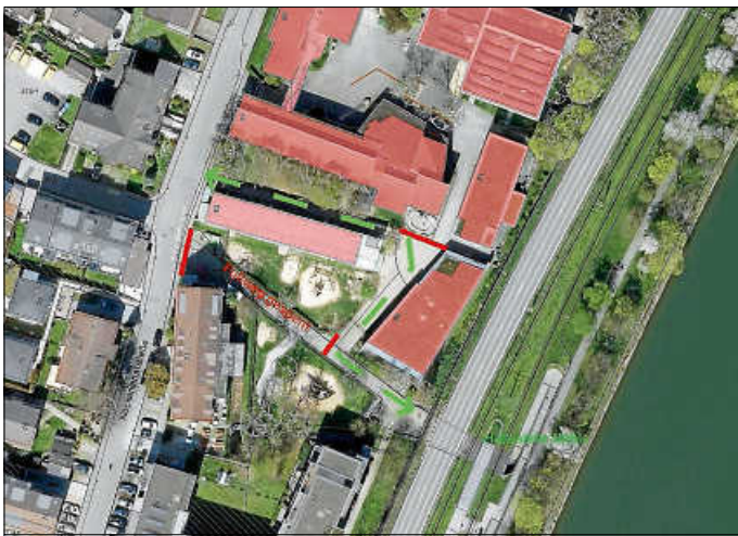
Lageplan Fußwegumleitung Mühle

Im Zuge der Baumaßnahmen am Bildungscampus Aldingen muss wegen Tiefbauarbeiten in der Zeit vom 13.05. bis 22.05.2024 der Fußweg von der Neckarkanalstraße zur U-Bahnhaltestelle Mühle kurzzeitig verlegt werden. Ein Umweg über das angrenzende Schulgelände wird ausgeschildert. Bitte beachten Sie die geänderte Wegführung.