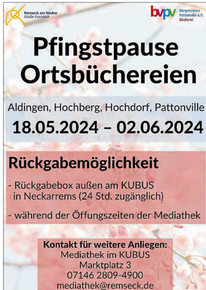
Plakat: Mediathek im KUBUS